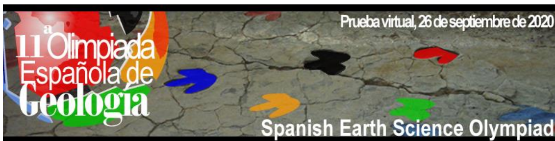
Figura 1.- Logo de la XI Olimpiada Española de Geología.

La gran acogida que han tenido las olimpiadas en los diez años anteriores animó a los organizadores a plantear esta actividad por undécimo año consecutivo y en este caso la Asociación Española para la Enseñanza de las Ciencias de la Tierra (AEPECT) contó con el apoyo de la Sociedad Geológica de España (SGE), del Instituto Geológico y Minero de España (IGME), de la Facultad de Ciencias Geológicas de la UCM, del Ilustre Colegio Oficial de Geólogos (ICOG), de la Fundación CEPSA, de la Asociación de Geólogos y Geofísicos Españoles del petróleo (AGGEP) y de REPSOL-YP. Asimismo, contó con la colaboración de la Conferencia de Decanos de Geología, GEOSN, el Grupo Santillana, la Universidad de Alcalá y la Escuela Técnica Superior de Ingenieros de Minas y Energía.