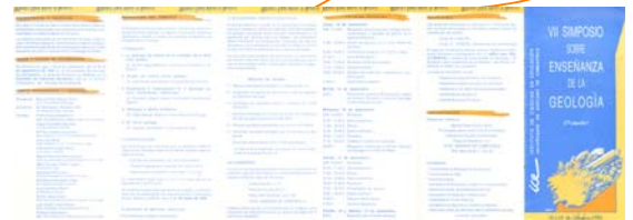
2ª Circular del Simposio