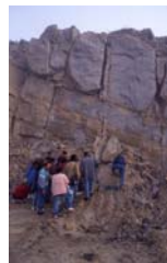
Trabajando en el campo

En la jornada del martes se realizaron seis actividades de campo con distintos niveles de complejidad, desde las más científicas como "Medios sedimentarios litorales en ambiente de ría" o el "Borde occidental del complejo de Ordes (A Coruña)", hasta las más didácticas como "Geología de la Mariña Lucense: la rasa costera" o el "Itinerario por la península del Barbanza", pasando por la "Explotación de lignito de As Pontes y visita al Laboratorio Xeolóxico de Laxe" o el "Itinerario geológico por los alrededores de la cuenca de Monforte (Lugo. Galicia centro-oriental)". Por primera vez también, se programaron las excursiones científicas post-simposio. Una de ellas "Geología del complejo de Cabo Ortegal" que se realizó en dos jornadas, durante el viernes y sábado, fue dirigida por el profesor Dr. Alberto Marcos de la Universidad de Oviedo.