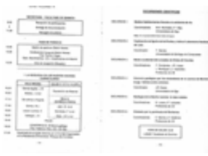
Parte del programa del Simposio