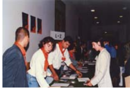
Recogida de documentación