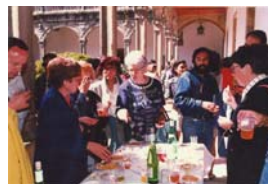
Vino de honor en el Claustro de Fonseca