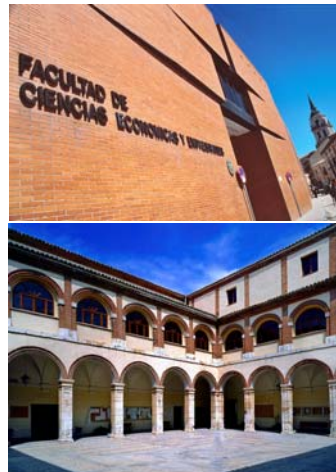
Universidad de Alcalá de Henares, sede del Simposio