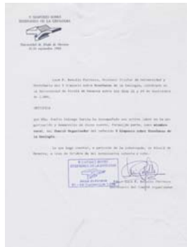
Certificado de asistencia